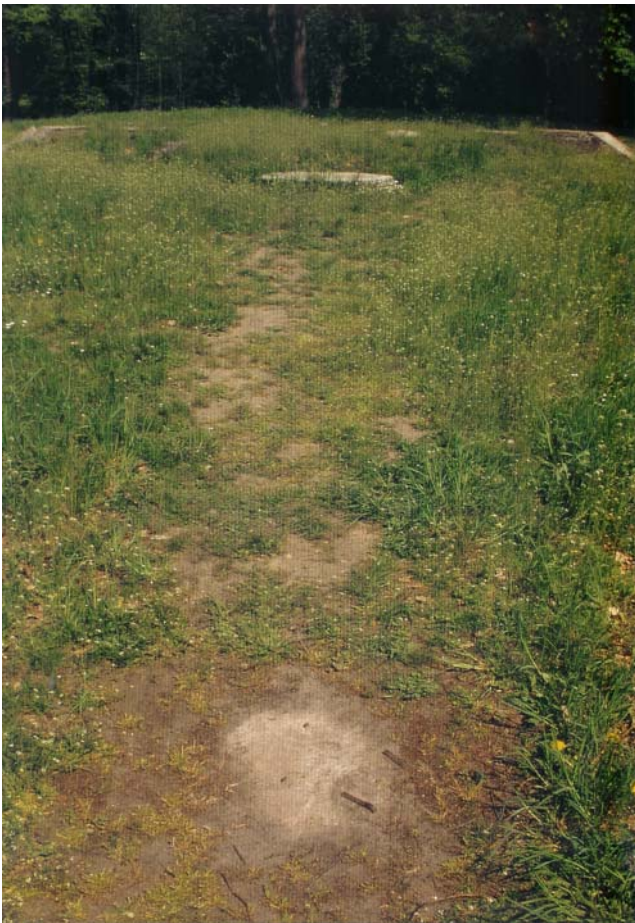
Das Foto von V. Mende zeigt die Reste des I-Sperrwerkes auf dem Glacis

Den ersten Hinweis dazu verdanke ich unserem (noch-nicht-Mitglied!) Festungsfreund Volker Mende aus Cottbus, der bei einer mehr archäologisch orientierten Begehung festgestellt hatte, dass sich im weiteren Vorfeld, auf dem unteren Teil des Glacis noch geringe Reste von weiteren baulichen Anlagen verstecken. Glücklicherweise hat er sie auch (noch rechtzeitig vor der Zuschüttung) fotografiert und mich darauf aufmerksam gemacht.